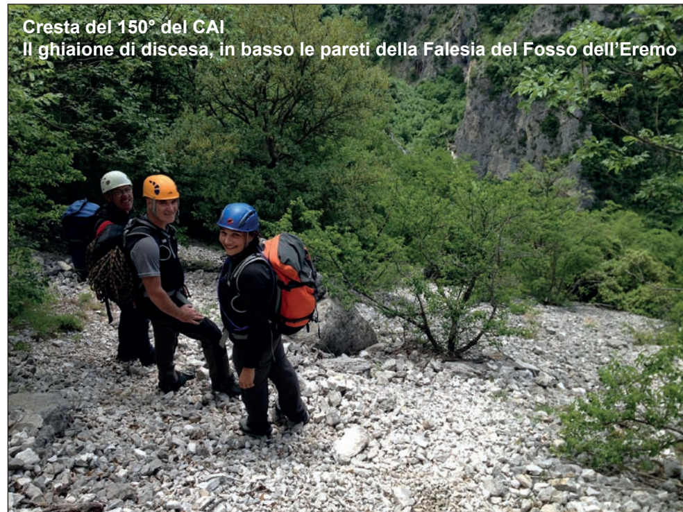
Cresta del 150° del CAI Il ghiaione di discesa, in basso le pareti della Falesia del Fosso dell'Eremo

DISCESA. Dalla cima, si ritorna all'anticima e si scende per facili roccette sul versante Ovest della montagna. Si prosegue per traccia costeggiando per circa una cinquantina di metri la base della parete. Poi in discesa sempre per tracce che conducono in un canalino. Alla fine del canalino si prosegue in traverso verso sinistra (faccia a valle) fino a montare su una crestina. Si scende verso destra in direzione Ovest/Sud/Ovest lungo la crestina all'inizio affilata e di rocce ripide, poi per pendio di rocce erbose a sinistra del filo della cresta fino a quando (ometto) è possibile scendere verso destra nel bosco sottostante passando nei pressi di una caratteristica grotta. La traccia, dopo un paio di tornanti prosegue in falso piano verso Nord/Ovest in direzione dell'at-