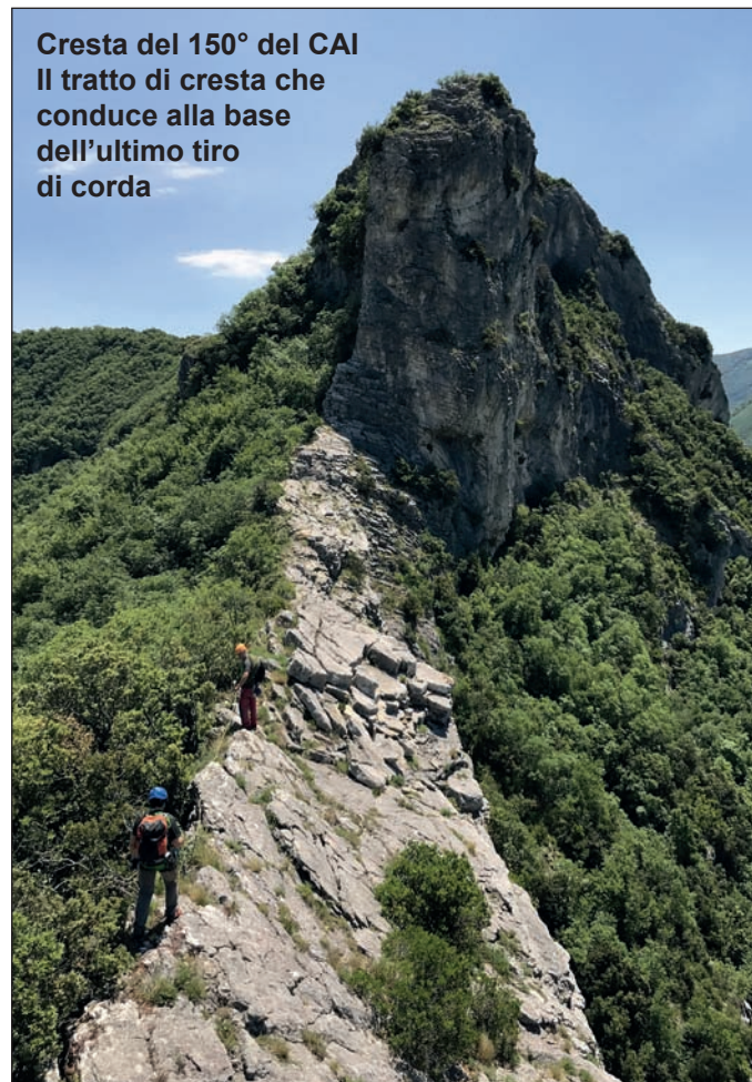
Cresta del 150° del CAI Il tratto di cresta che conduce alla base dell'ultimo tiro di corda