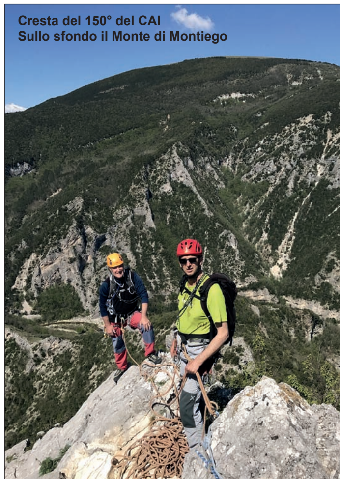
Cresta del 150° del CAI Sullo sfondo il Monte di Montiego