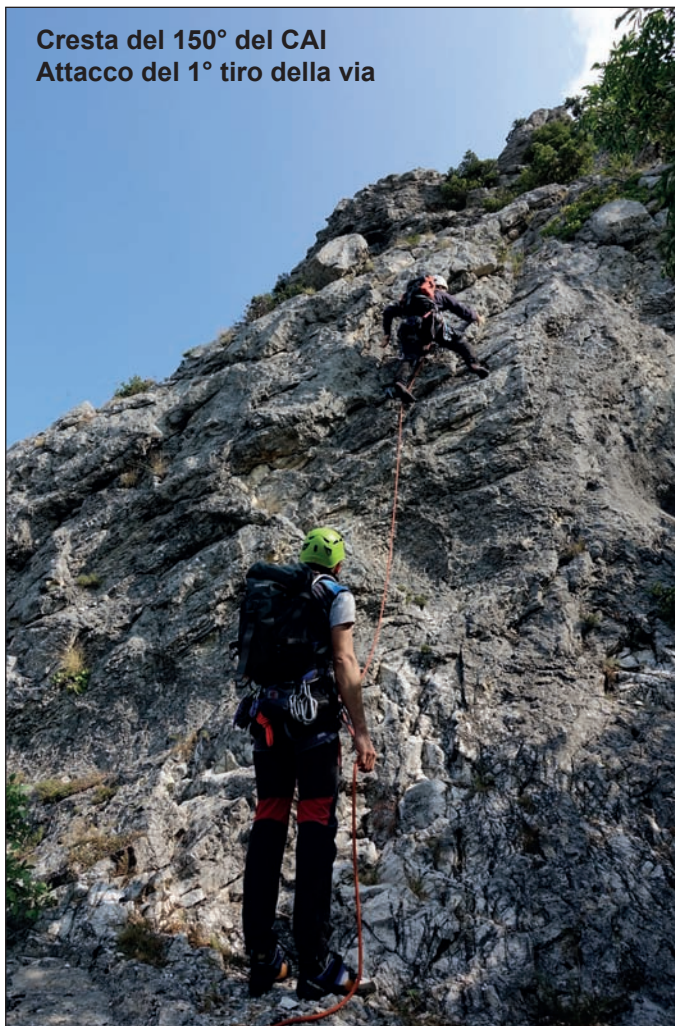
Cresta del 150° del CAI Attacco del 1° tiro della via