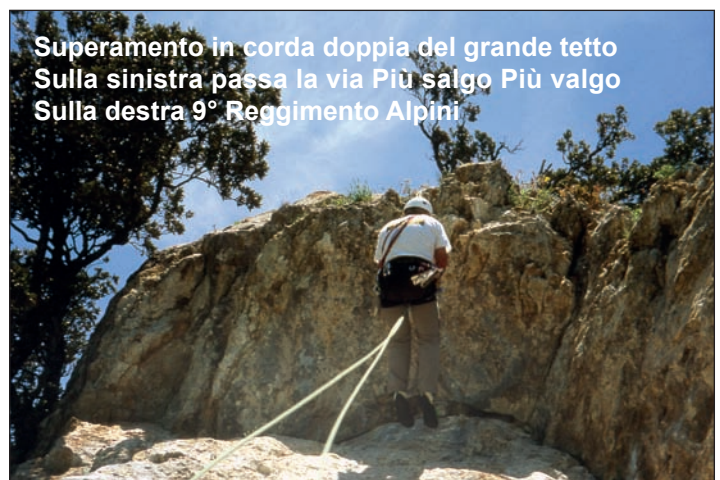
Superamento in corda doppia del grande tetto Sulla sinistra passa la via Più salgo Più valgo Sulla destra 9° Reggimento Alpini