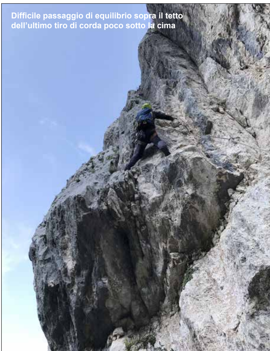
Difficile passaggio di equilibrio sopra il tetto dell'ultimo tiro di corda poco sotto la cima

NOTE. Si tratta di una bellissima linea di salita alpinistica in ambiente selvaggio e solitario ma con chiodatura "stile falesia". La ricerca del "facile" nel "difficile", un bel "viaggio" attraverso le fasce strapiombanti della Parete Ovest della Punta Anna del Monte Nerone, partendo dalla "cengia basale" della parete con obiettivo la cima. La via è stata interamente salita dal basso in più riprese. La roccia è il calcare massiccio del Monte Nerone: da buona a ottima. Scalata varia e sostenuta, in diversi tratti molto esposta, tecnicamente interessante in ogni lunghezza di corda. La buona e "generosa" chiodatura dell'itinerario, non deve trarre in inganno, resta comunque una salita di ambiente che richiede impegno. Vivamente consigliato il concatenamento con la "Via dell'Amicizia" in quanto lungo la discesa si passa nei pressi dell'attacco di quest'ultima. Con il concatenamento si mettono insieme undici lunghezze di corda di bella arrampicata varia e sostenuta.