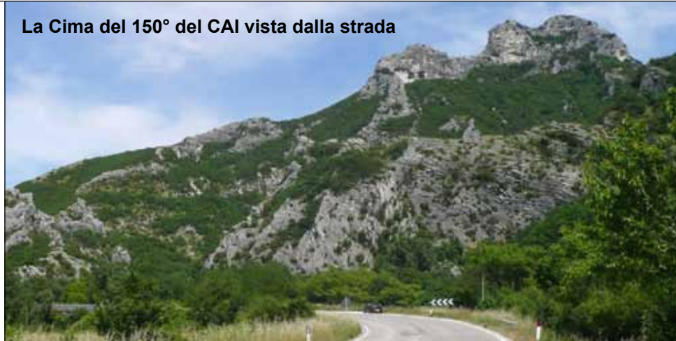
La Cima del 150° del CAI vista dalla strada

Anniversario della Fondazione del CAI è stata nominata dagli autori di questo itinerario: Cima del 150° del CAI. Il percorso proposto è in parte utilizzato dagli alpinisti, come avvicinamento e come via di discesa dopo avere raggiunto la cima tramite la via alpinistica della Cresta del 150° del CAI. Si tratta di un'escursione entusiasmante quanto impegnativa. L'intero percorso si svolge per gran parte in ambiente impervio e infido, su terreno vario e poco agevole seguendo spesso vecchie tracce di sentiero non sempre evidenti e creste rocciose esposte che richiedono, in alcuni punti l'uso delle mani. Se pure abbastanza breve e a quote relativamente basse, è molto interessante sia per l'aspetto tecnico che ambientale; un percorso per escursionisti evoluti che amano cimentarsi in un ambiente di avventura, su terreno di ricerca, consigliato a chi vuole vivere in solitudine una bella giornata di montagna. Difficoltà: EE.