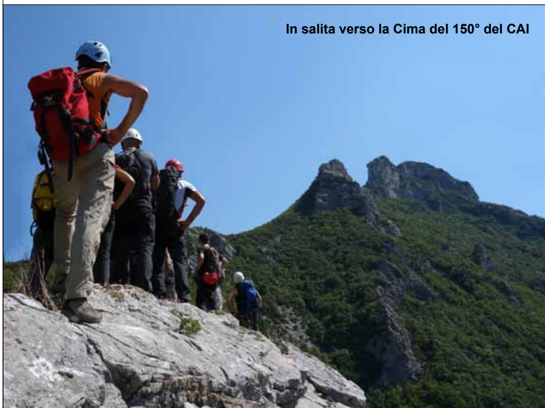
In salita verso la Cima del 150° del CAI

destra. Si prosegue sempre in salita per evidente ma ripida traccia fino a raggiungere la parte superiore del bosco pensile alla base della parete superiore. Si costeggia verso sinistra la parete fino a quando un ripido pendio ci permette di salire. Alcuni passaggi su rocce gradinate ci consentono di arrivare alla cresta e l'Anticima. Si prosegue sempre per cresta in direzione sud per 100 metri circa, fino a rag-