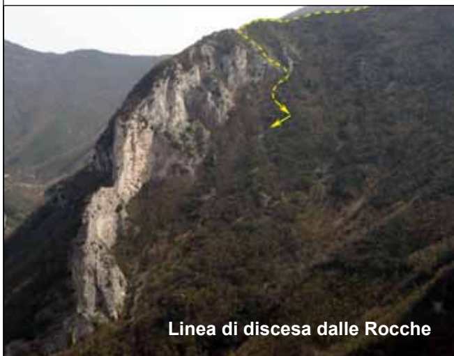
Linea di discesa dalle Rocche

DESCRIZIONE DELLA DISCESA. La discesa si può fare seguendo lo stesso itinerario di salita evitando eventualmente la prima parte della salita e scendere per il ghiaione che si incontra a metà percorso, (ometto in basso all'inizio del ghiaione, vedi relazione di salita) oppure dalla cima, proseguendo in traversata fino alle Rocche con discesa per il versante Nord/Ovest di queste belle pareti rocciose. Se si sceglie questa seconda opzione, (consigliata perché è un completamento dell'escursione) dalla cima si prosegue scendendo per pendio di rocce erbose verso est, in direzione dell'evidente parete rossastra a strati piegati.