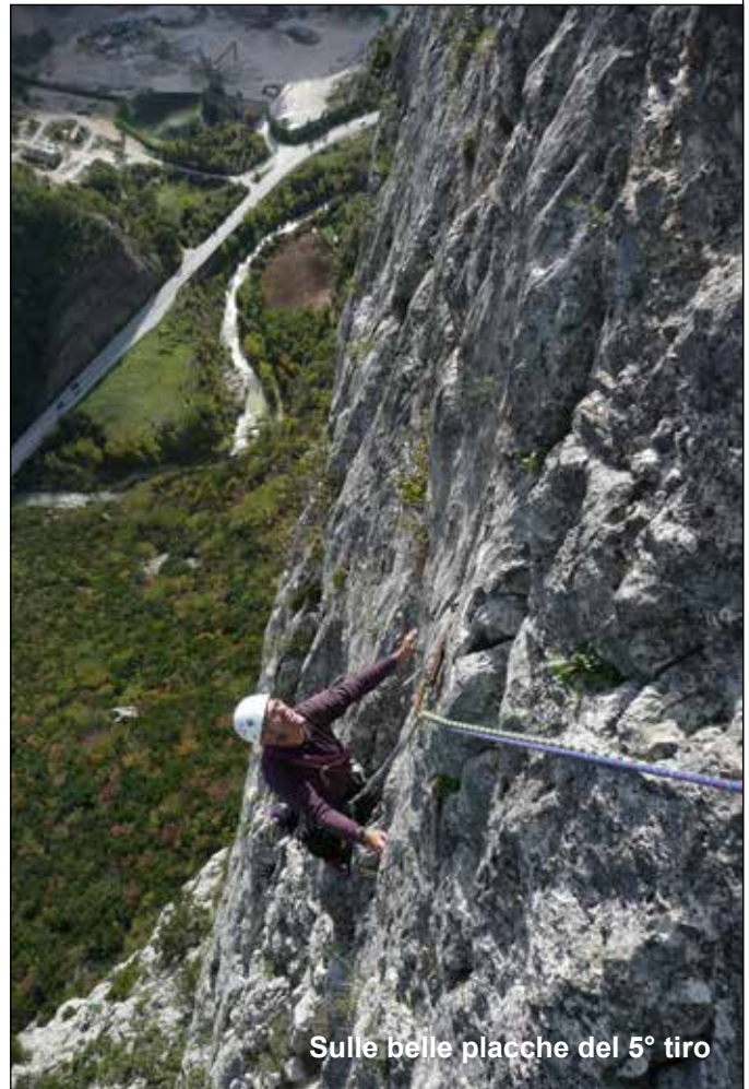
Sulle belle placche del 5° tiro