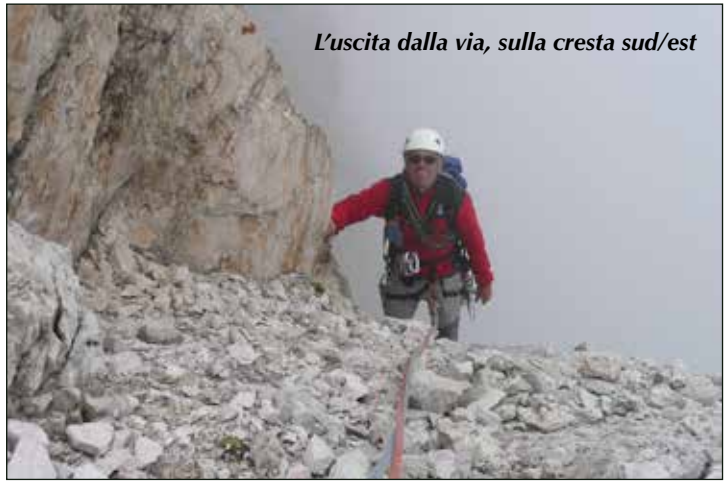
L'uscita dalla via, sulla cresta sud/est

pagnato a una poco attenta lettura della relazione sarebbe stato molto difficile la mattina della salita riuscire a individuare l'attacco senza grosse perdite di tempo. Infatti, lo schizzo a differenza della relazione lascia