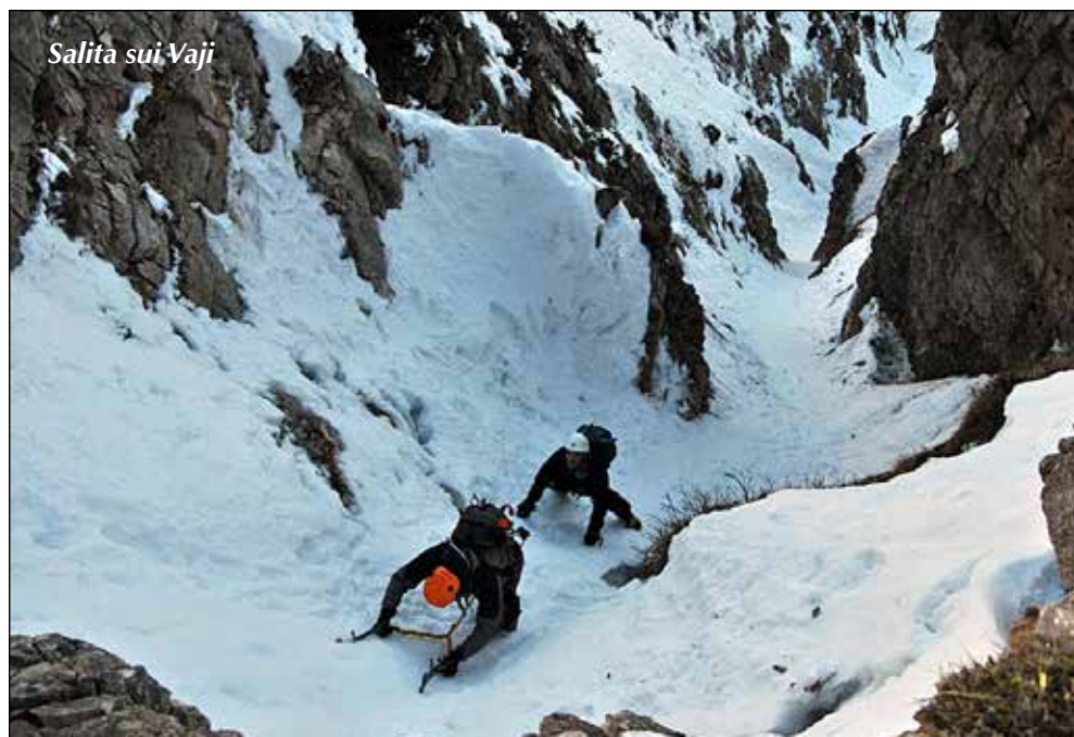
Salita sui Vaji

Direttore uscita: INA Nereo Savioli - Cell. 329.0906784