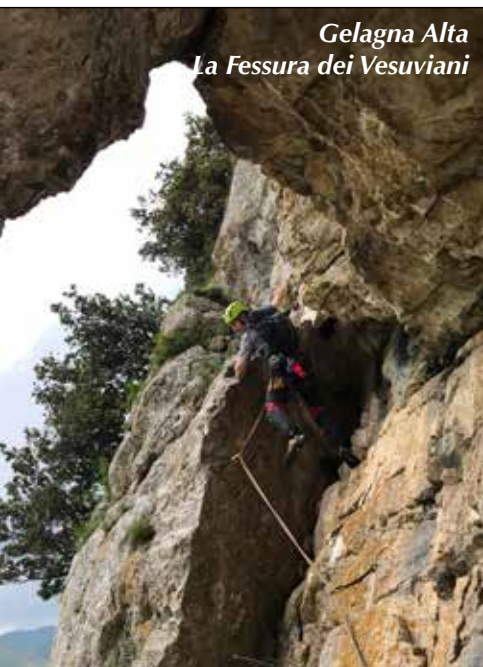
Gelagna Alta La Fessura dei Vesuviani