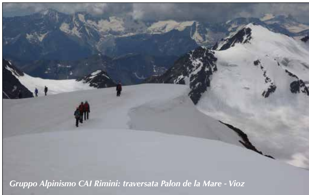
Gruppo Alpinismo CAI Rimini: traversata Palon de la Mare - Vioz