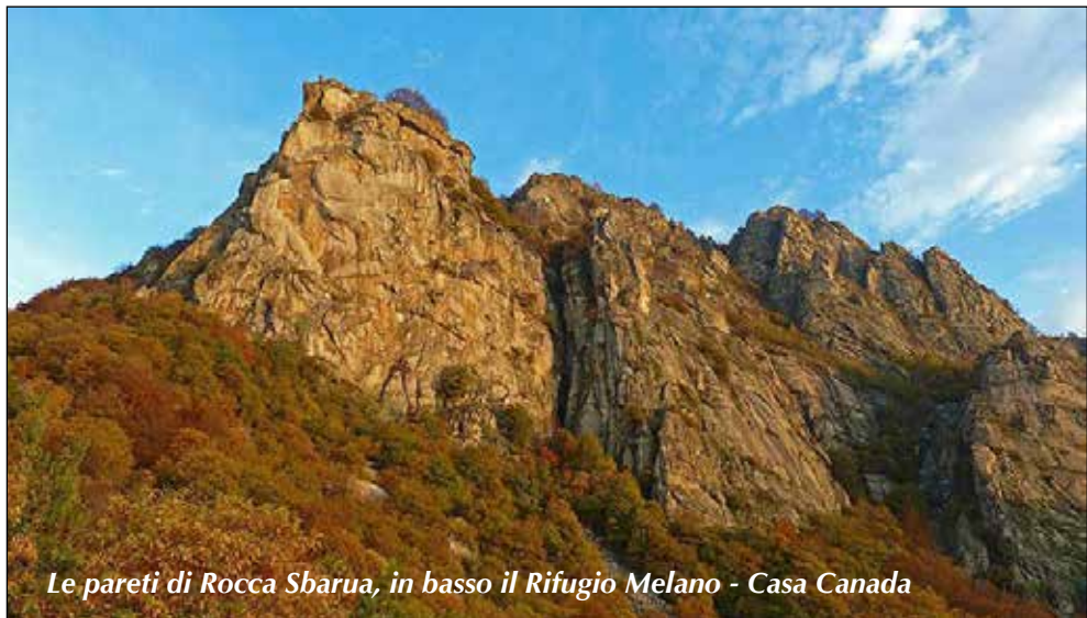
Le pareti di Rocca Sbarua, in basso il Rifugio Melano - Casa Canada

Venerdì 12, Sabato 13 e Domenica 14 Ottobre 2018 ROCCA SBARUA (Torino)