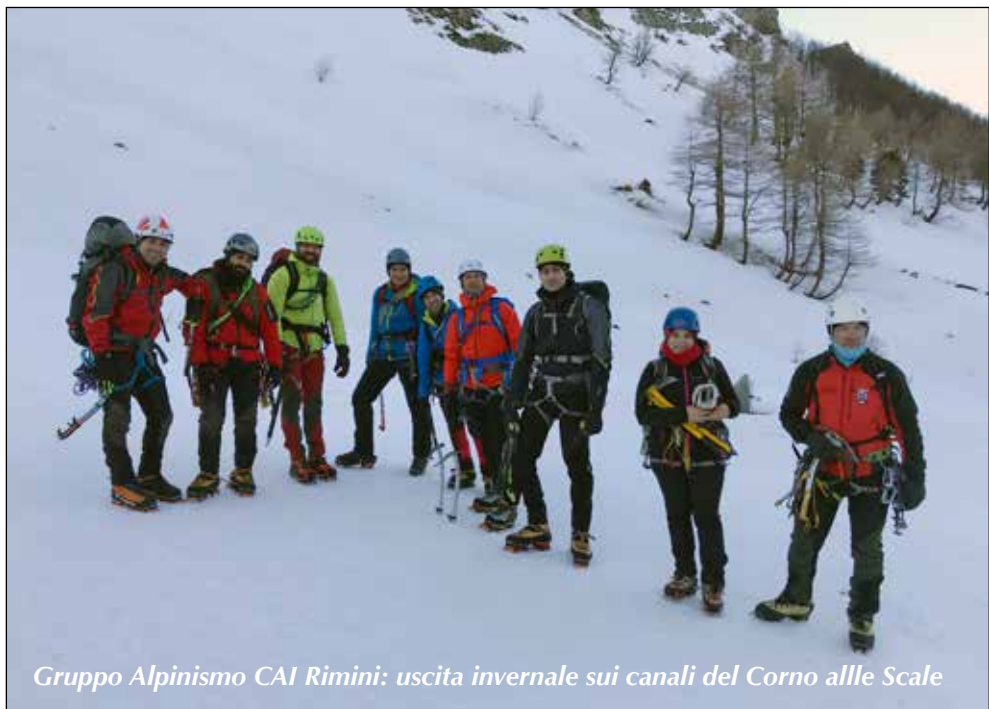
Gruppo Alpinismo CAI Rimini: uscita invernale sui canali del Corno alle Scale