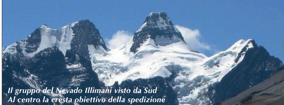
Il gruppo del Nevado Illimani visto da Sud Al centro la cresta obiettivo della spedizione