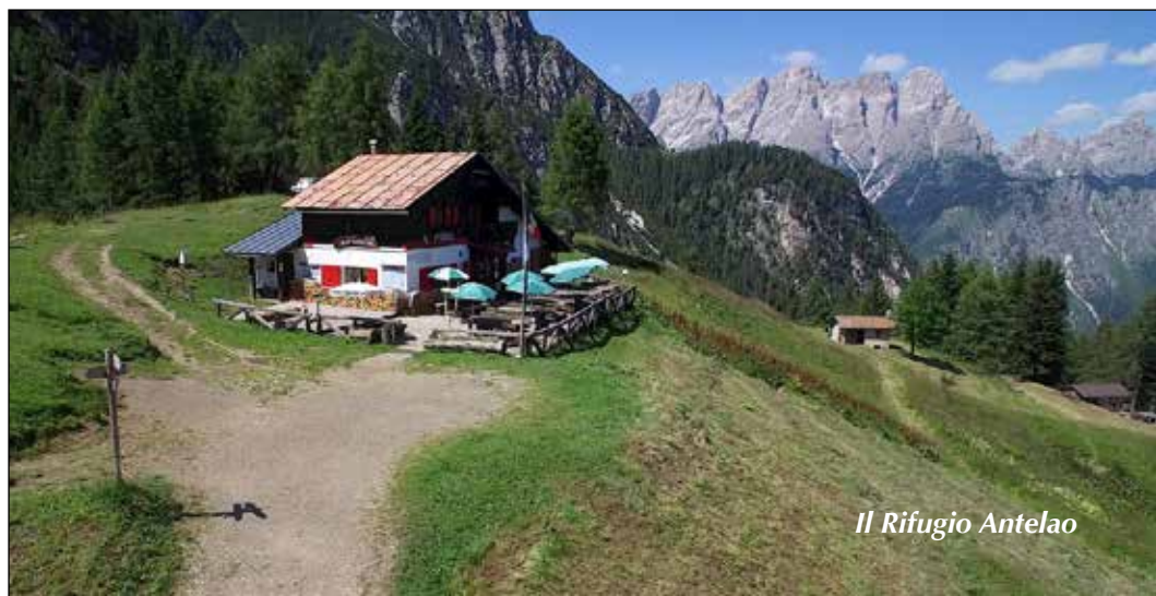
Il Rifugio Antelao