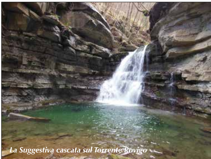
La Suggestiva cascata sul Torrente Rovigo

L'escursione proposta si svolge nell'Alto Appennino Imolese nella Valle del Santerno. Nella piccola frazione di Casetta Tiara, nell'estate del 1916, per un breve e intenso periodo, soggiornarono e intersecarono le loro vite la scrittrice Sibilla Aleramo e l'autore dei "Canti Orfici", il tormentato poeta Dino Campana. Da allora, in molteplici aspetti il paesaggio, non è mutato, in quanto, nonostante la modernità, questi luoghi un po' appartati hanno