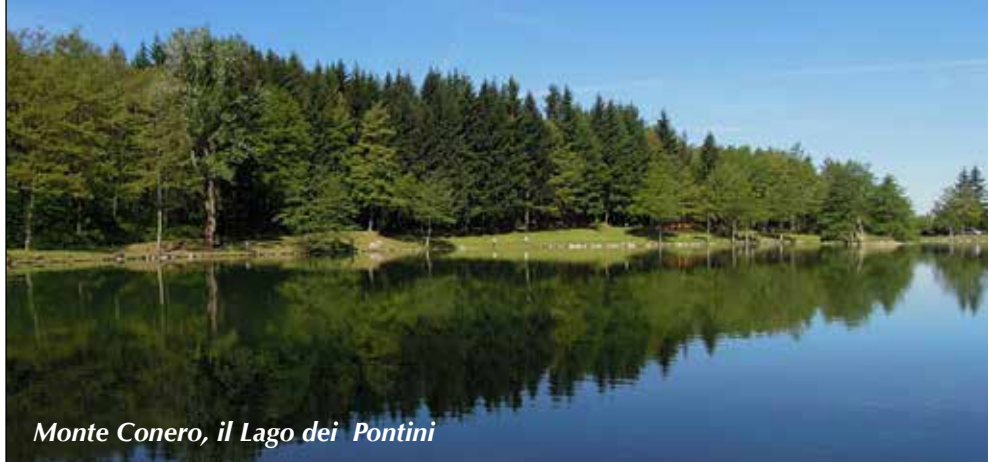
Monte Comero, il Lago dei Pontini