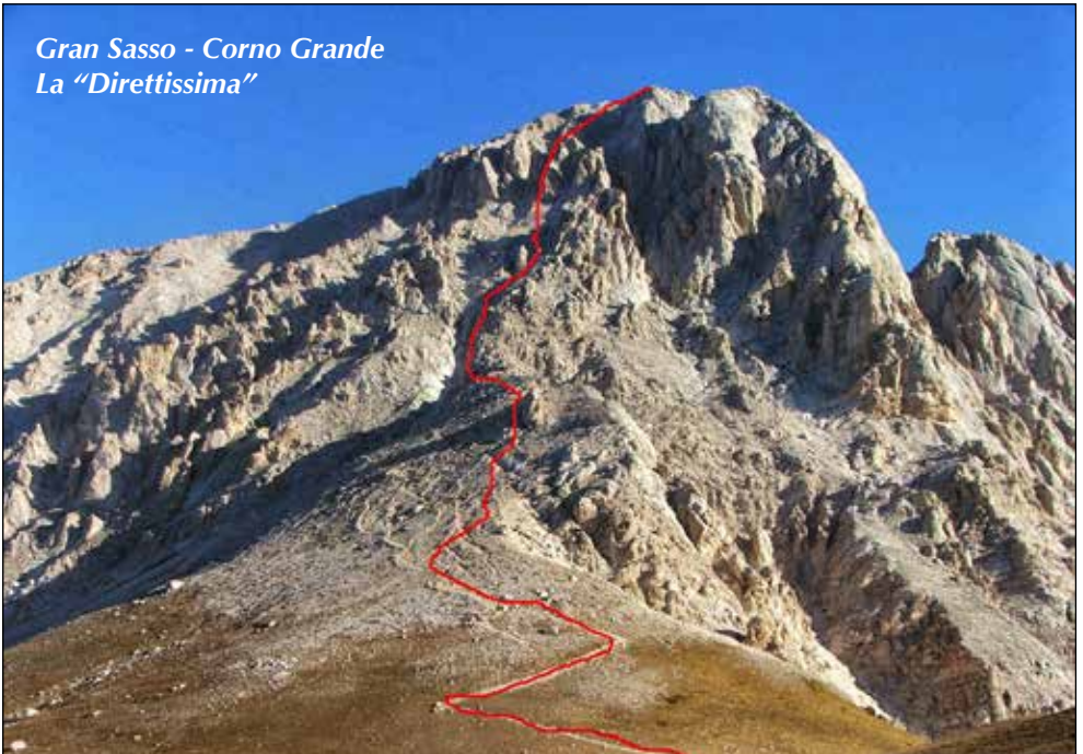
Gran Sasso - Corno Grande La "Direttissima"

Vicedirettore: AE Silvano Orlandi - Cell. 339.6975901