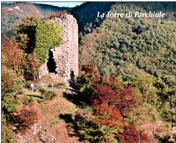
La Torre di Parchiule

Siamo ai piedi dell'Alpe della Luna nella stretta valle del Torrente Auro che, insieme al vicino Meta, dà origine al Fiume Metauro. L'escursione partirà dall'antico borgo di Parchiule risalente all'epoca pre-romantica. Da qui prenderemo il Sentiero CAI N° 390 che abbandoneremo una volta giunti in località Villa dalla quale imboccheremo il Sentiero CAI N° 390 D che ci porterà al cospetto della torre d'avvistamento medioevale risalente alla metà del XIII Secolo. Proseguendo giungeremo al punto più alto della nostra escursione il Poggio dell'Appione (1020 m) e da