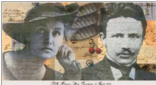
La scrittrice Sibilla Aleramo e il poeta Dino Campana