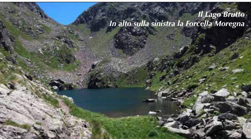
Il Lago Brutto In alto sulla sinistra la Forcella Moregna

Da Predazzo si sale in automobile, per 8 km per buona strada stretta ma parzialmente asfaltata, fino alla Malga Valmaggiora (1620 m). Con il segnavia N° 339 si sale, senza grandi strappi, per stradello e mulattiera e poi per sentiero più stretto e sconnesso fino alla Malga Moregna e al bel lago omonimo, appena più sotto (2058 m). Ritornando sul 339 si continua, con bellissimi scorci sul Latemar, per la sella a 2170 metri di quota e si scende alla pittoresca conca del Laghetto delle Trote (2103 m). Il terzo lago, a dispetto del nome, Lago Brutto, è il più bello e lo si raggiunge con sentiero impervio risalendo un dislivello di 200 metri. È incastrato in una stretta valle e lo si contorna per metà, ammirandone poi le sue acque scure anche dopo averlo lasciato durante la salita finale alla Forcella di Moregna (2397 m), punto più alto del percorso. La visione è amplissima sulla Cima Cece, sulle tante altre vicine vette dei Lagorai e ancora sul Latemar. La discesa ci guida