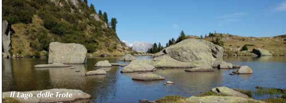
Il Lago delle Trote