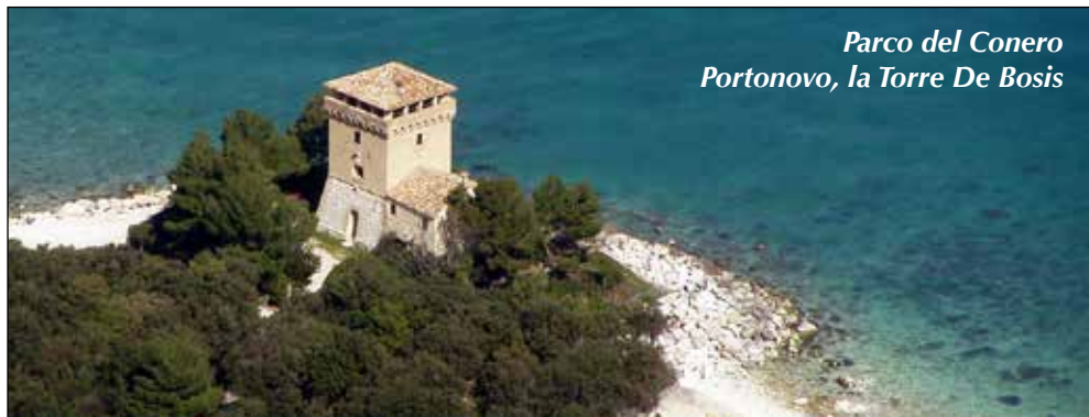
Parco del Conero Portonovo, la Torre De Bosis