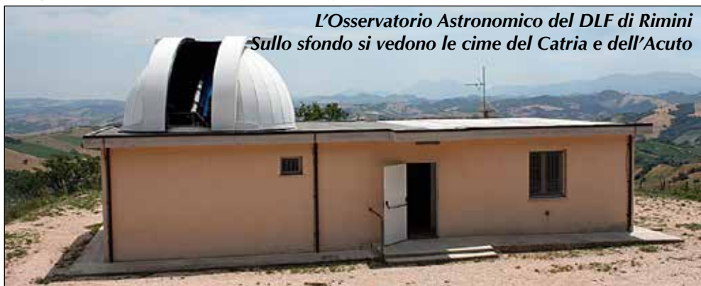
L'Osservatorio Astronomico del DLF di Rimini Sullo sfondo si vedono le cime del Catria e dell'Acuto

Tempo: 4 h; dislivello salita: 350 m; lunghezza: 11 km; difficoltà: T