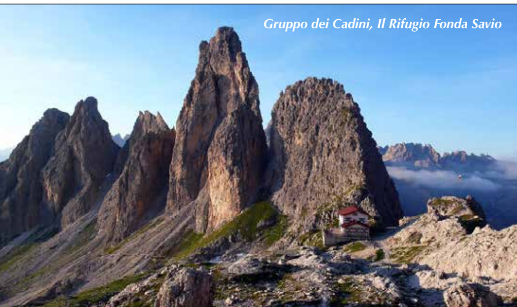
Gruppo dei Cadini, Il Rifugio Fonda Savio

CADINI DI MISURINA E SULL'ALTA VIA DELLE DOLOMITI N°4 (Belluno)