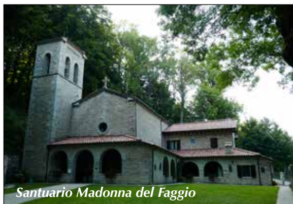
Santuario Madonna del Faggio

del Parco, ci darà la possibilità di ammirare le sue bellezze, i panorami le fioriture e le ricche specie animali che lo popolano. Inoltre porteremo a conoscenza dei partecipanti come si effettua la parte pratica della Segnatura di un sentiero e la dislocazione dei segni, per far capire l'importanza di un sentiero segnato e il lavoro dei volontari che si prodigano in una attività molte volte sottovalutata, ma ricca invece di soddisfazioni. N.B. I dati riportati nella descrizione riguardanti la tipologia