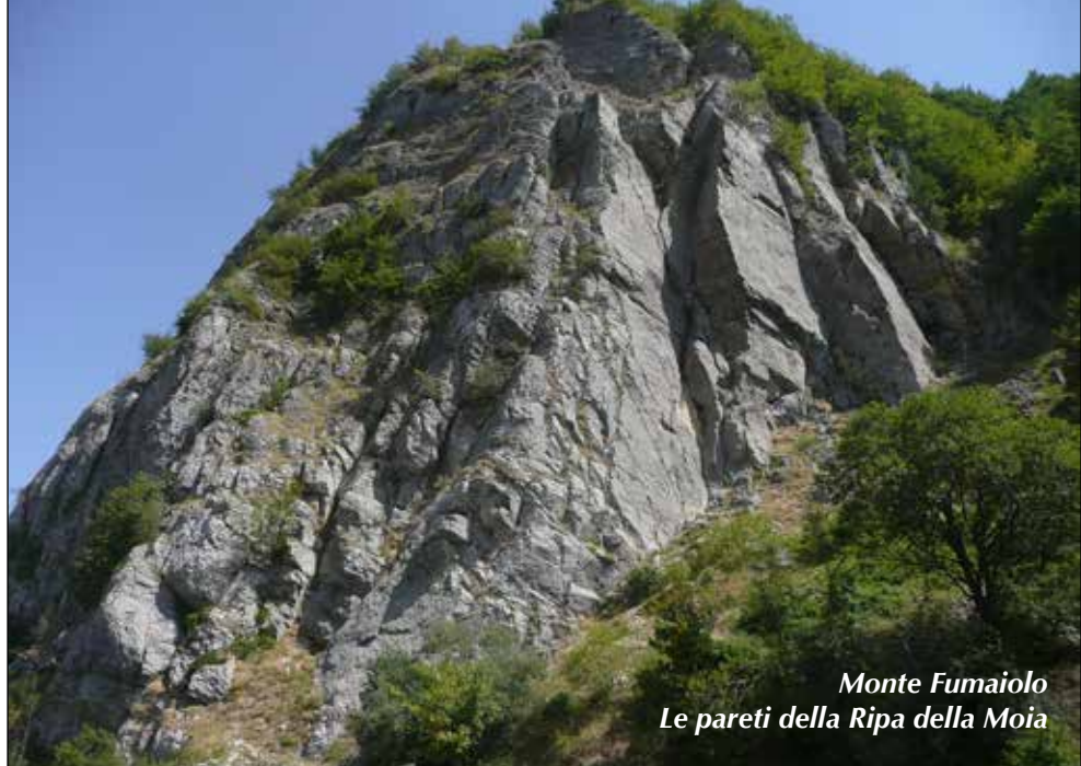
Monte Fumaiole Le pareti della Ripa della Moia

Domenica 14 Luglio 2019 NEL PARCO NAZIONALE DELLE FORESTE CASENTINESI (Forlì-Cesena) Tempo: 5 h; dislivello salita: 550 m; lunghezza: 14 km; difficoltà: E