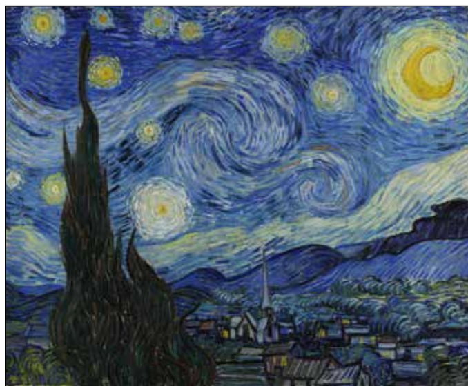
A sinistra il celebre dipinto di Vincent van Gogh, "Notte Stellata"