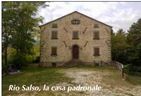
Rio Salso, la casa padronale