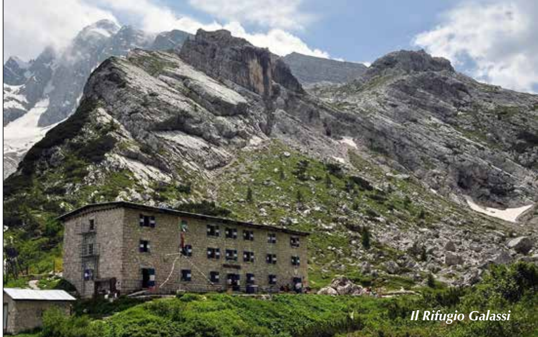
Il Rifugio Galassi

Mercoledì 21: RIF. FONDA SAVIO - PIAN DEI SPIRITI - SAN VITO DI CADORE - BAITA SUN BAR - RIF. SCOTTER PALATINI - RIF. SAN MARCO - RIF. GALASSI