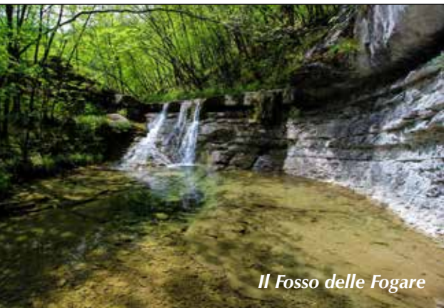
Il Fosso delle Fogare

Tempo: 6 h; dislivello salita: 700 m; lunghezza: Km 12,5; difficoltà: EE