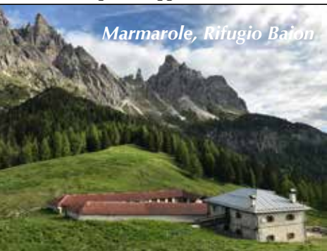
Marmarole, Rifugio Baiòn

Chiggiato, regala una bella veduta sulle Marmarole occidentali, l'Antelao e la Val d'Oten. Per il rientro, si segue un tranquillo sentiero che costeggia la casera d'Aieron e attraversando pascoli e zona boscata ci riconduce al nostro punto di partenza.