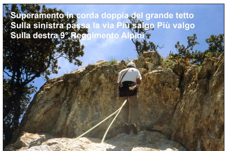
Superamento in corda doppia del grande tetto Sulla sinistra passa la via Più salgo Più valgo Sulla destra 9° Reggimento Alpini