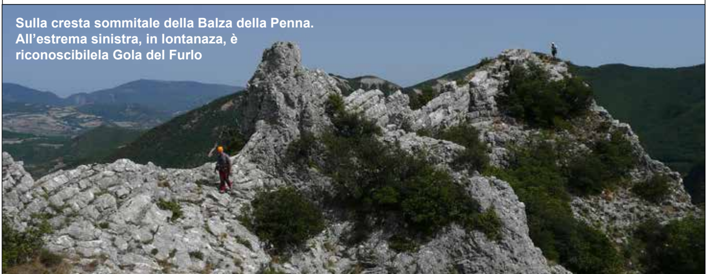
Sulla cresta sommitale della Balza della Penna. All'estrema sinistra, in lontananza, è riconoscibile la Gola del Furlo