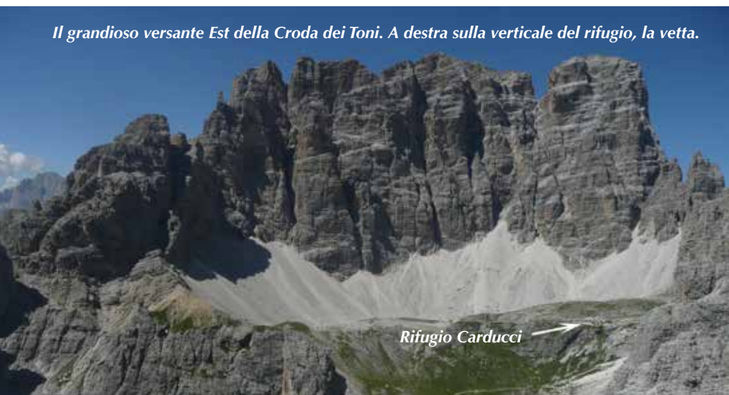
Rifugio Carducci →

Il grandioso versante Est della Croda dei Toni. A destra sulla verticale del rifugio, la vetta.