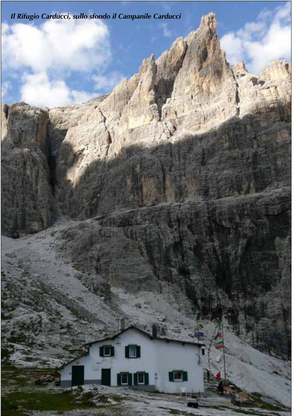
Il Rifugio Carducci, sullo sfondo il Campanile Carducci