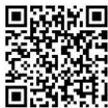
Museo degli sguardi