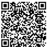
Santuario di Santa Maria delle Grazie

L'anello può essere abbreviato utilizzando come variante il Sentiero CAI N° 029A.