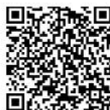
Abbazia di S. Maria Annunziata Nuova di Scolca