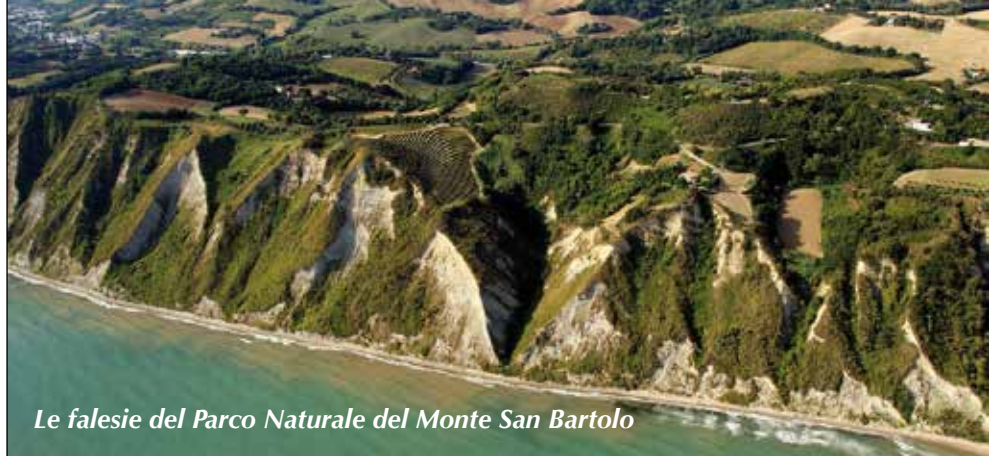
Le falesie del Parco Naturale del Monte San Bartolo