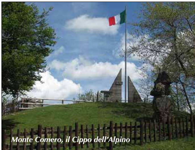
Monte Comero, il Cippo dell'Alpino