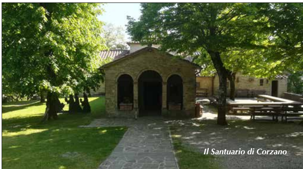
Il Santuario di Corzano