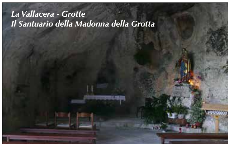
La Vallacera - Grotte Il Santuario della Madonna della Grotta

Bellissima escursione nel Parco Naturale della Gola Della Rossa, su terreno a tratti impervio e selvaggio. La prima parte del percorso, fino a Poggio San Romualdo, non presenta particolari difficoltà se si eccettua la ripida salita alle falde del Monte Pietroso. La