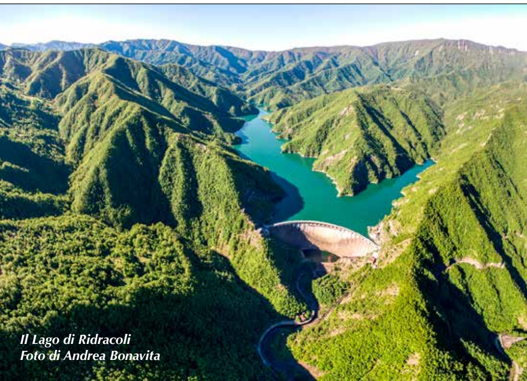
Il Lago di Ridracoli