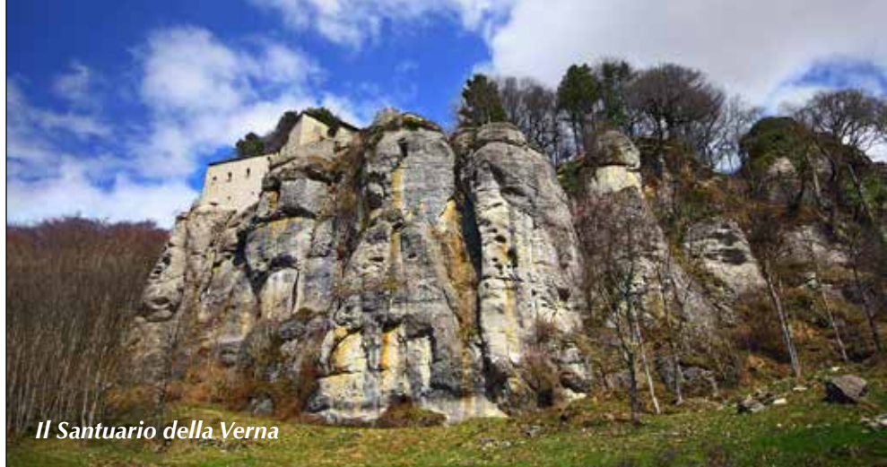
Il Santuario della Verna