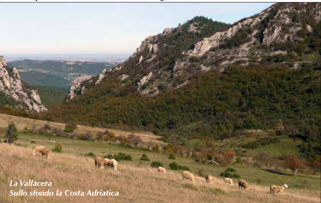
La Vallacera Sullo sfondo la Costa Adriatica

Tempo: 6 h; dislivello salita: 700 m; lunghezza: 14 km; difficoltà: E