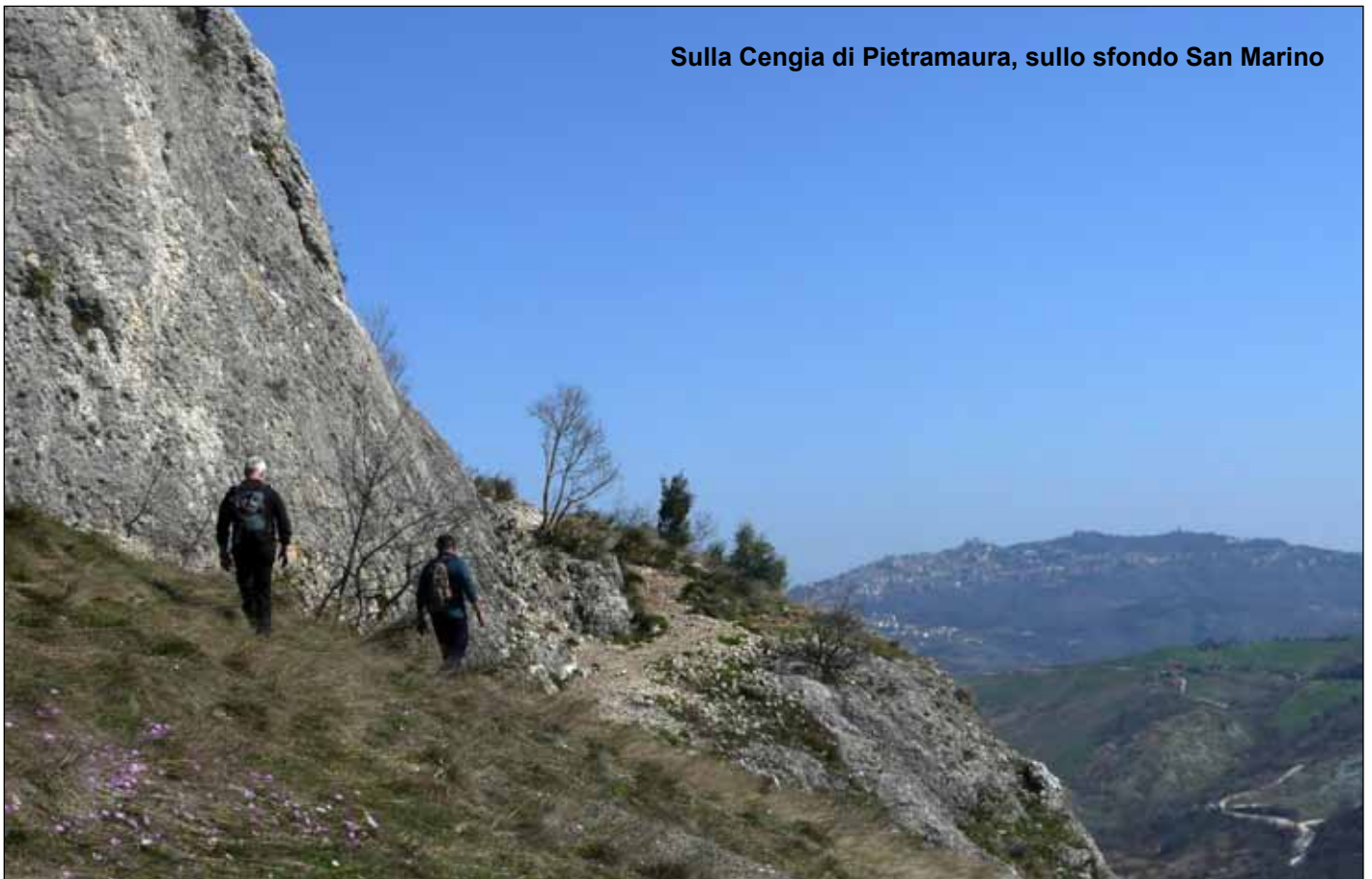
Sulla Cengia di Pietramaura, sullo sfondo San Marino