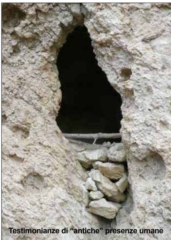
Testimonianze di "antiche" presenze umane