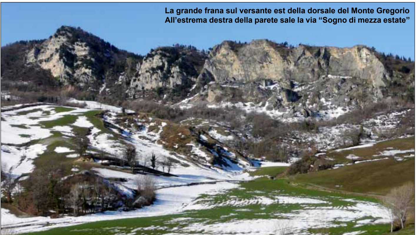
La grande frana sul versante est della dorsale del Monte Gregorio All'estrema destra della parete sale la via "Sogno di mezza estate"