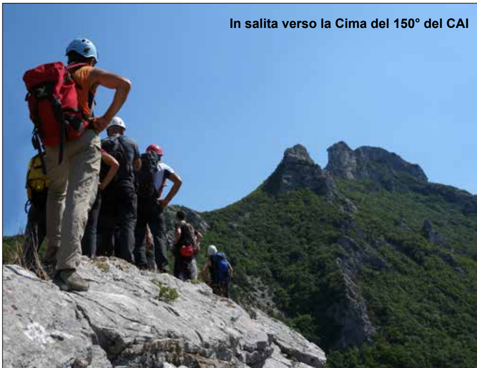
In salita verso la Cima del 150° del CAI

e si prosegue in traverso alla base della parete fino a guadagnare (passaggio esposto) un canale che va risalito per qualche metro fino ad uscire per rocce gradinate sulla destra. Si prosegue poi verso sinistra sempre in salita per evidente ma ripida traccia fra la bassa vegetazione fino a raggiungere la base della parete superiore. Si costeggia verso sinistra la base della parete fino a quando un ripido pendio ci permette di salire. Alcuni passaggi su rocce gradinate ci consentono di arrivare alla cresta