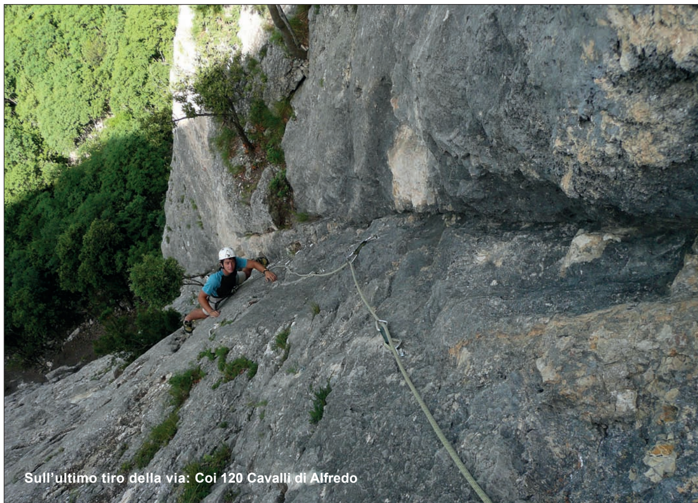
Sull'ultimo tiro della via: Coi 120 Cavalli di Alfredo