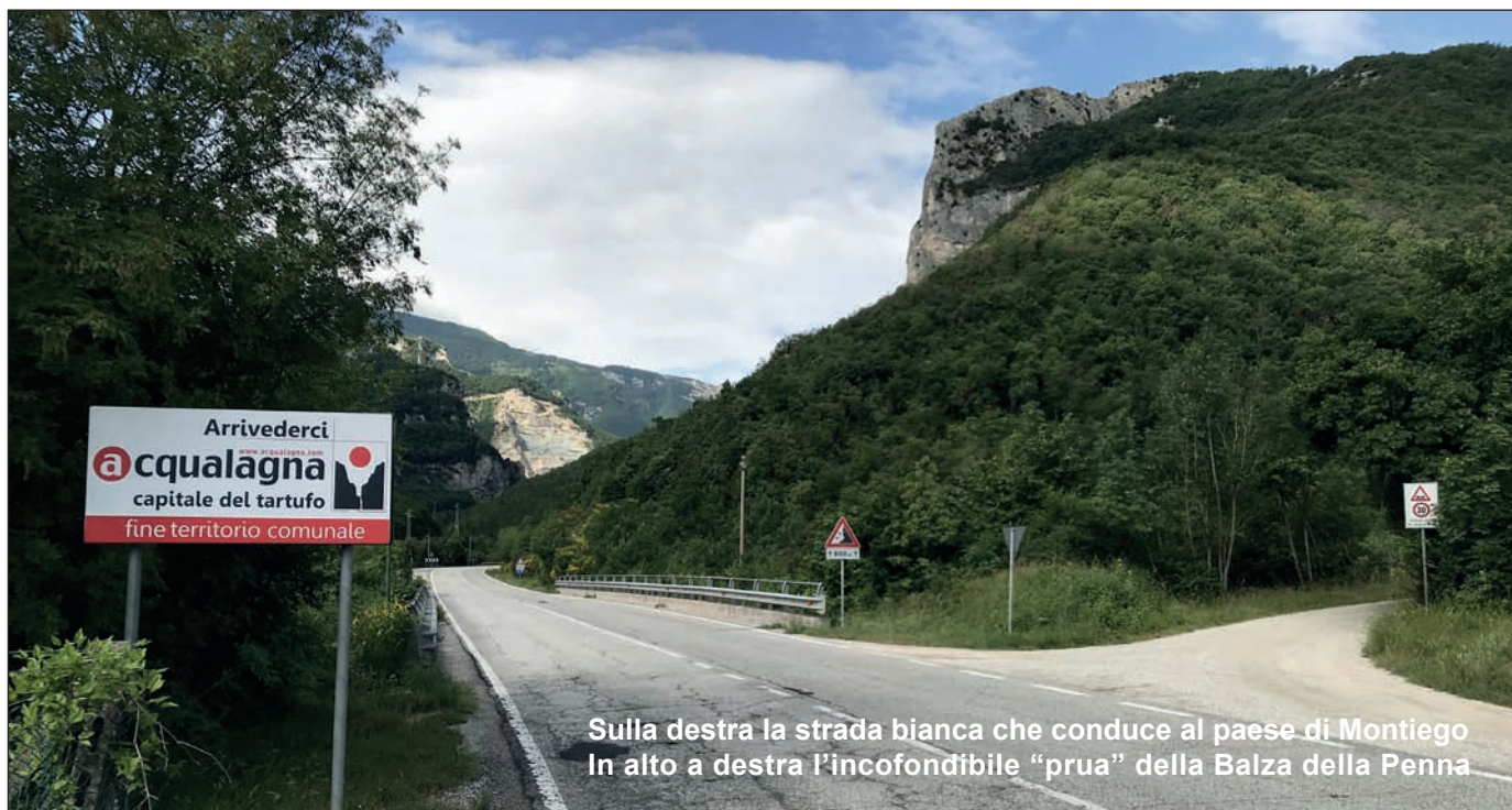
Sulla destra la strada bianca che conduce al paese di Montiego In alto a destra l'inconfondibile "prua" della Balza della Penna