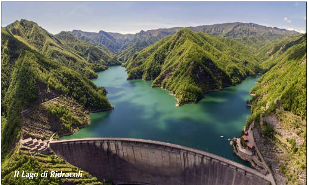
Il Lago di Ridracoli