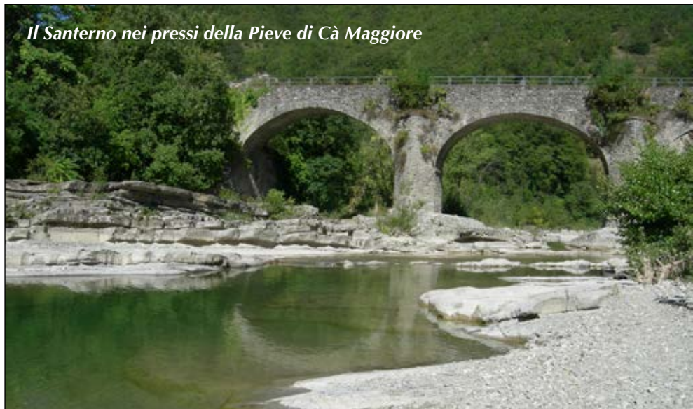
Il Santerno nei pressi della Pieve di Cà Maggiore