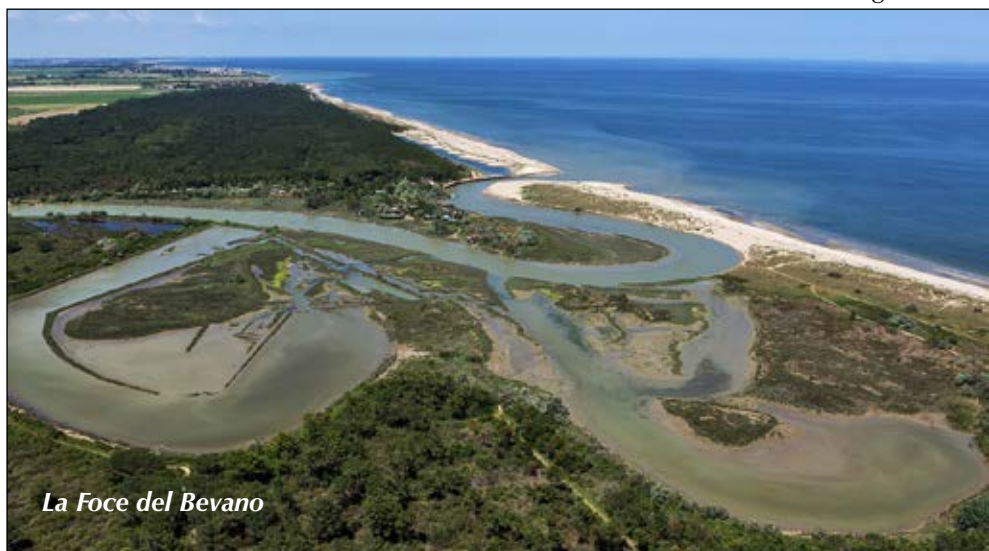
La Foce del Bevano