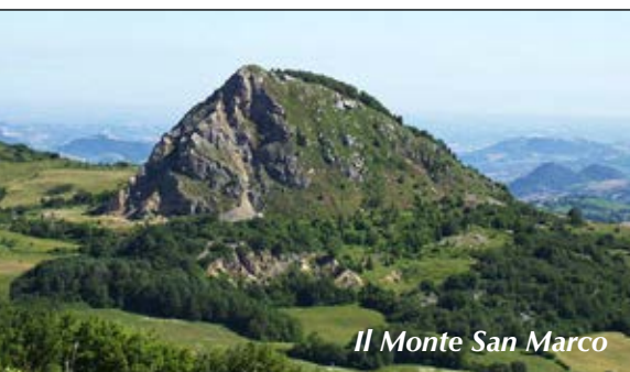
Il Monte San Marco

Tempo: 4 h; dislivello salita: 420 m; lunghezza: 8 km; difficoltà: E