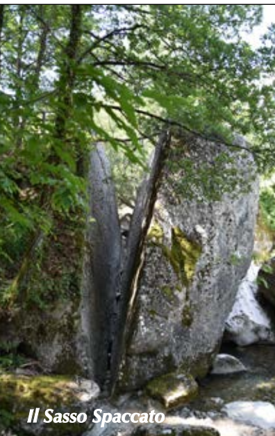
Il Sasso Spaccato

Tempo: 4,30 h; dislivello salita: 500 m; lunghezza: 11,5 km; difficoltà: E