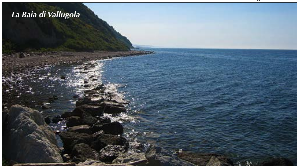
La Baia di Vallugola