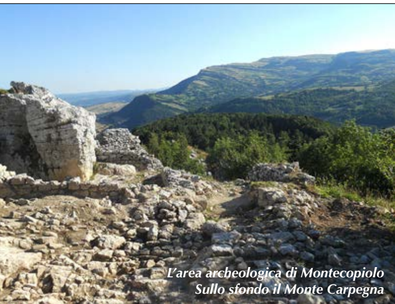
L'area archeologica di Montecopiolo Sullo sfondo il Monte Carpegna

La partenza avviene da Villagrande di Montecopiolo dalla Piazza San Michele Arcangelo. Si imbecca in salita la strada del Pirusello che conduce al Monte della Pennuzza, si prosegue raggiungendo il valico del Passo San Marco, si imbecca il sentiero che costeggia il recinto del pascolo arrivando alla sommità del Monte Pennuzza dove si può beneficiare di una vista mozzafiato a 360° sulle vallate circostanti. Scendendo nuovamente