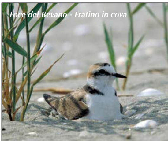
Foce del Bevano - Fratino in cova