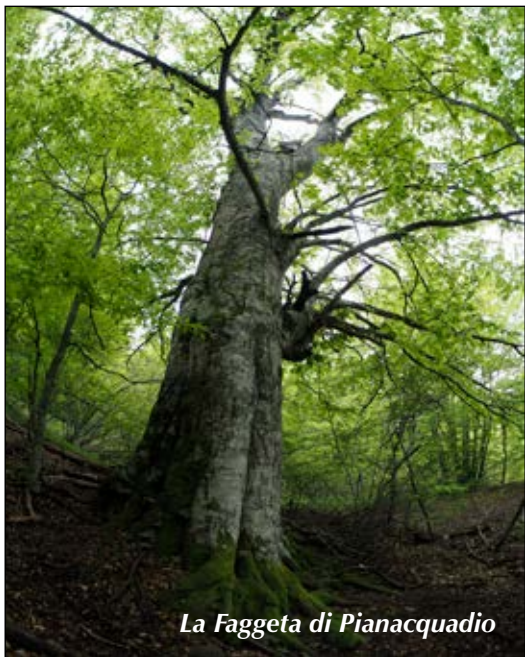
La Faggeta di Pianacquadio