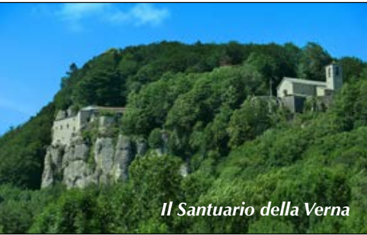
Il Santuario della Verna

Tempo: 7 h (compreso la visita); dislivello salita: 750 m; lunghezza: 16 km; difficoltà: E