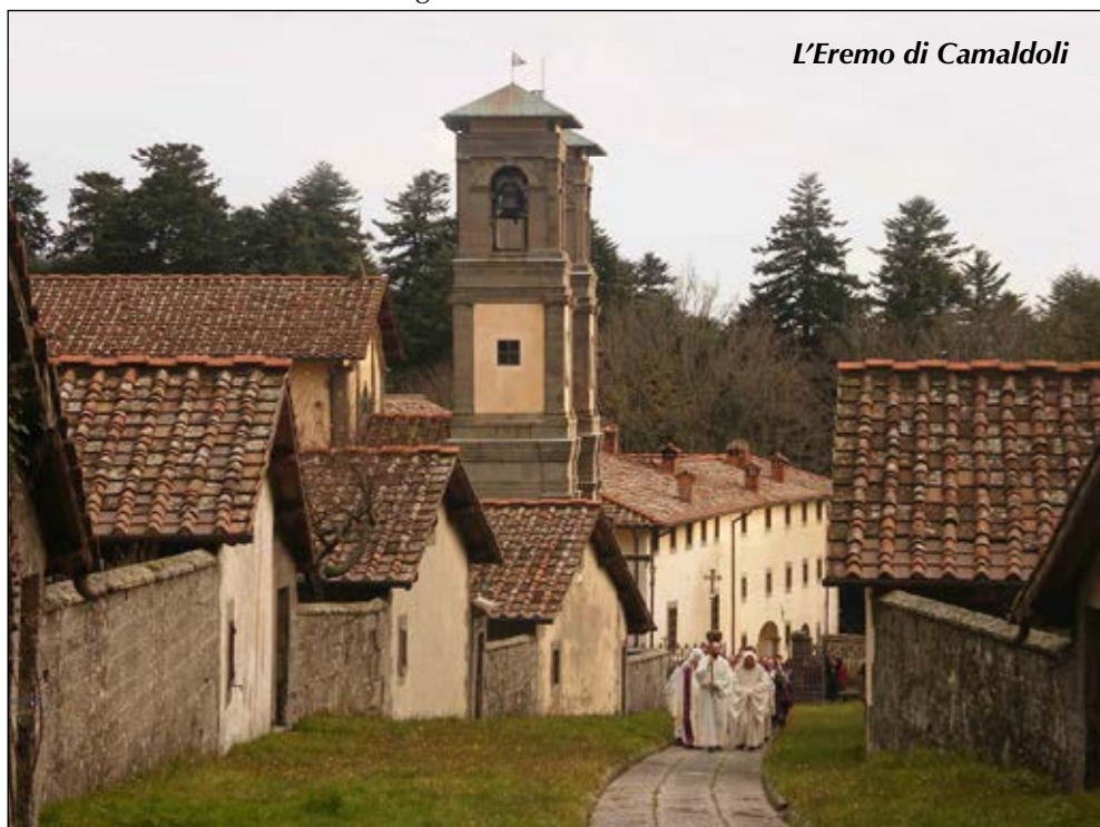
L'Eremo di Camaldoli

Ritrovo a Badia Prataglia (Arezzo) alle ore 08:45 di fronte al "Bar Impero" via Nazionale 30. Direttore escursione: ONC Giorgio Ricci - Cell. 335.7734405.