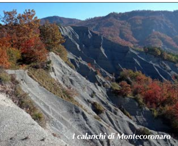
I calanchi di Montecoronaro

Tempo: 6 h; dislivello salita: 850 m; lunghezza: 17 km; difficoltà: E