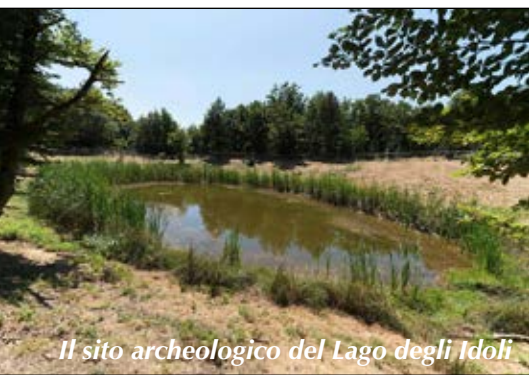
Il sito archeologico del Lago degli Idoli

Itinerario classico delle Foreste Casentinesi, che alle bellezze paesaggistiche e naturalistiche, unisce luoghi d'interesse storico, archeologico e letterario. Si parte dal Passo della Calla (1295 m) e si prende il Sentiero CAI 00 che seguendo il crinale sale fino al Monte Falco, la cima più alta dell'Appennino Tosco-Romagnolo (1657 m), con una splendida veduta che spazia a 360° dal Mare Adriatico a San Marino, dalle Prealpi alle Alpi, dal Monte Cimone alla veduta di Firenze, dall'Amiata alla catena del Gran Sasso e dei Monti Sibillini. Proseguendo sullo stesso sentiero circondato da radure e da una foresta alternata di faggi e pino mugo si arriva al Monte Falterona (1654 m). Scenderemo poi fino a Capo d'Arno (la sorgente del Fiume Arno), in cui è posta una lapide che ricorda i versi del XIV Canto del Purgatorio della Divina Commedia. In questo canto Dante Alighieri ricorda il luogo dal quale sicuramente passava per recarsi in