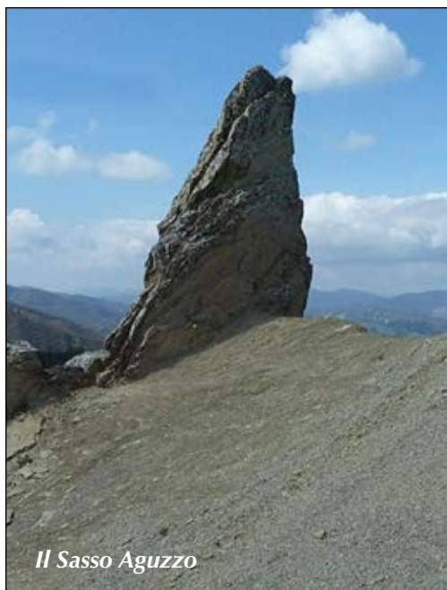
Il Sasso Aguzzo

Tempo: 6 h; dislivello salita: 700 m; lunghezza: 13 km; difficoltà: EE