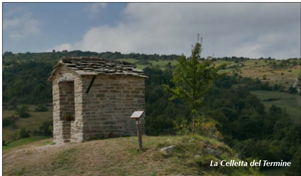
La Celletta del Termine