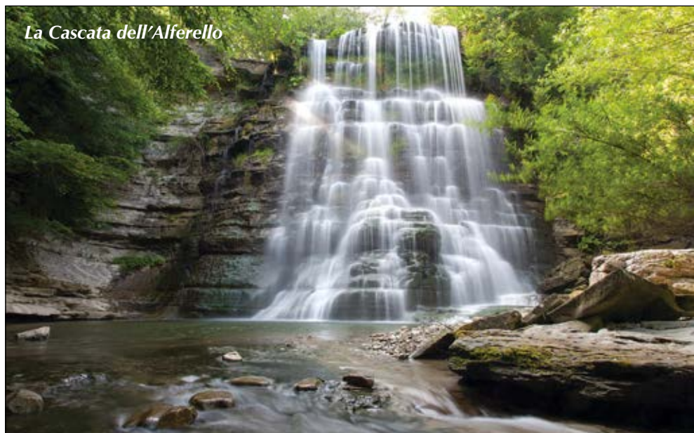
La Cascata dell'Alferello