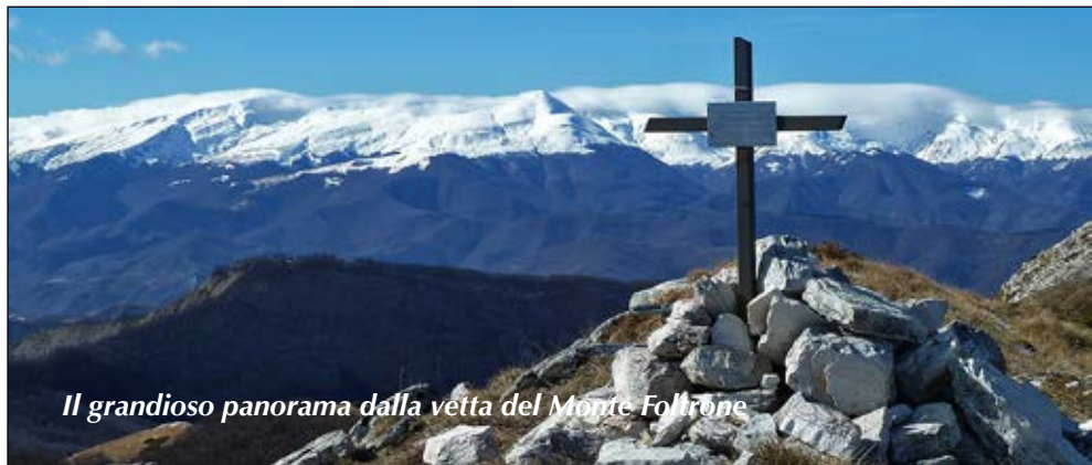
Il grandioso panorama dalla vetta del Monte Foltrone