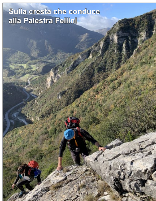
Sulla cresta che conduce alla Palestra Fellini

AVVICINAMENTO A PIEDI DALL'AGRITURISMO LA CAPRARECCIA. Si percorre in automobile la SP 257 Apecchiese, che da Acqualagna porta a Piobbico. Giunti in prossimità della balza della Penna, anziché imboccare sulla destra la strada bianca che conduce al Paese di Montiego si prosegue sulla strada provinciale. Oltrepassata la Balza della Penna e subito dopo la Cava di