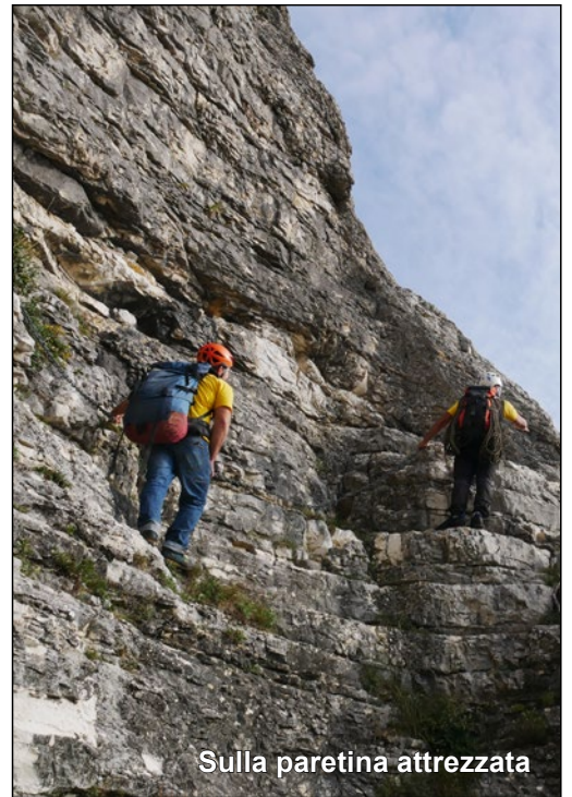
Sulla paretina attrezzata

AVVICINAMENTO A PIEDI DAL PAESE DI MONTIEGO. Si percorre in leggera salita lo stradello lastricato che attraversa l'agglomerato di case. Arrivati alla fontana si segue la bella mulattiera con la particolare Via Crucis che porta al Monte di Montiego. A ridosso dei prateroni sommitali della Balza della Penna si abbandona lo stradello segnato che porta in cima al Monte di Montiego, e si continua verso sinistra. Giunti in prossimità di una vecchia recinzione, in corrispondenza di un imponente ometto di pietre a forma di cono, si scende verso destra, lungo un pendio detritico con vegetazione rada seguendo un'evidente traccia con numerosi ometti. Alla nostra destra, non visibile, si trova la conca dell'Anfiteatro del Montiego. Giunti in prossimità del bordo della sua Cresta Est dell'Anfiteatro, sulla destra un evidente varco fra la vegetazione conduce ad una lingua di ghiaione che scende verso il bordo. Un breve tratto attrezzato con una catena, permette di scendere la parete sottostante. Alla fine del tratto attrezzato si continua a scendere per traccia lungo il canale fino al suo termine. A questo punto si sale brevemente verso destra per continuare in piano in direzione del centro dell'anfiteatro. Giunti ad un bivio, se si scende verso sinistra si raggiunge il Settore Basso della palestra, se si prosegue in salita verso destra si raggiungono il Settore Alto e il Settore Scuola. 30 minuti.