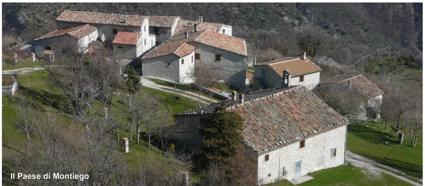
Il Paese di Montiego

NOTA. Se invece si intende raggiungere la palestra partendo dalla Strada Provinciale Apecchiese, dal bivio per il paese di Montiego, occorre proseguire in automobile lungo la strada provinciale per un chilometro e mezzo circa, per raggiungere il vicino Agriturismo “La Caprareccia” dove ha inizio il sentiero che porta alla “Falesia Atlantide” e prosegue per la “Palestra di Roccia Fellini”. Vedi pagina con descrizione avvicinamenti.