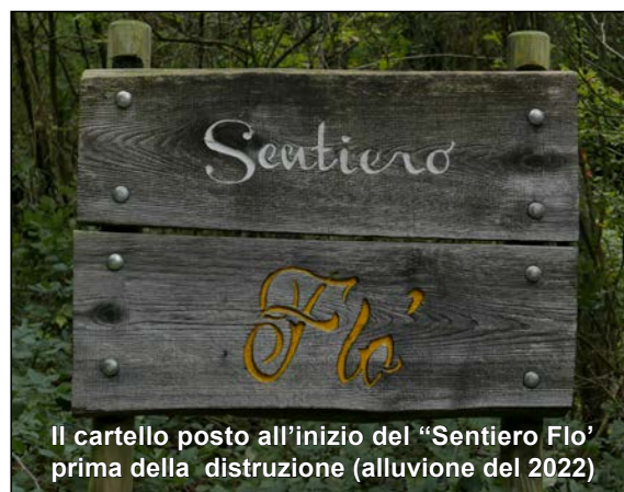
Il cartello posto all'inizio del "Sentiero Flo' prima della distruzione (alluvione del 2022)

Il Sentiero Flo' ha subito significative trasformazioni a seguito delle frane e degli smottamenti provocati dall'alluvione che ha colpito duramente queste zone nel 2022. La parte iniziale del tracciato, che in origine costeggiava e in alcuni tratti seguiva il letto del Torrente Cinisco, è oggi nuovamente percorribile grazie a un percorso in alcuni punti profondamente modificato. Nella parte centrale, dove la valle si restringe in un canale, le frane avevano reso il sentiero impraticabile. Tuttavia, da dicembre 2024, il tratto è stato reso accessibile grazie all'apertura di una variante. Questa deviazione si sviluppa sulla sinistra del canale, passando su placche di roccia attrezzate con cavi d'acciaio e gradini metallici.