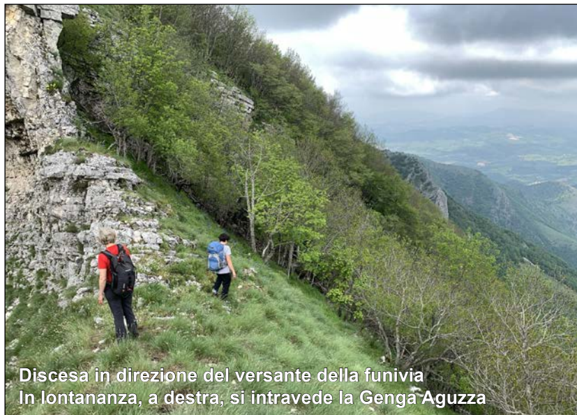
Discesa in direzione del versante della funivia In lontananza, a destra, si intravede la Genga Aguzza

DISCESA 1. Dalla spalla erbosa, si abbandona la cresta verso destra in direzione Nord, per prendere, dopo pochi metri in leggera discesa, una breve cengia che permette di raggiungere il pendio boscoso intersecato dalla linea dei piloni della funivia. Alla fine della cengia, raggiunto il pendio boscoso, si prende una poco evidente traccia di sentiero che, tagliando con lievi saliscendi tutto il pendio, porta in breve ad un pilone della funivia e da qui per stradello di servizio al pilone, alla vicina strada bianca proveniente dal parcheggio della funivia, dove si è parcheggiata