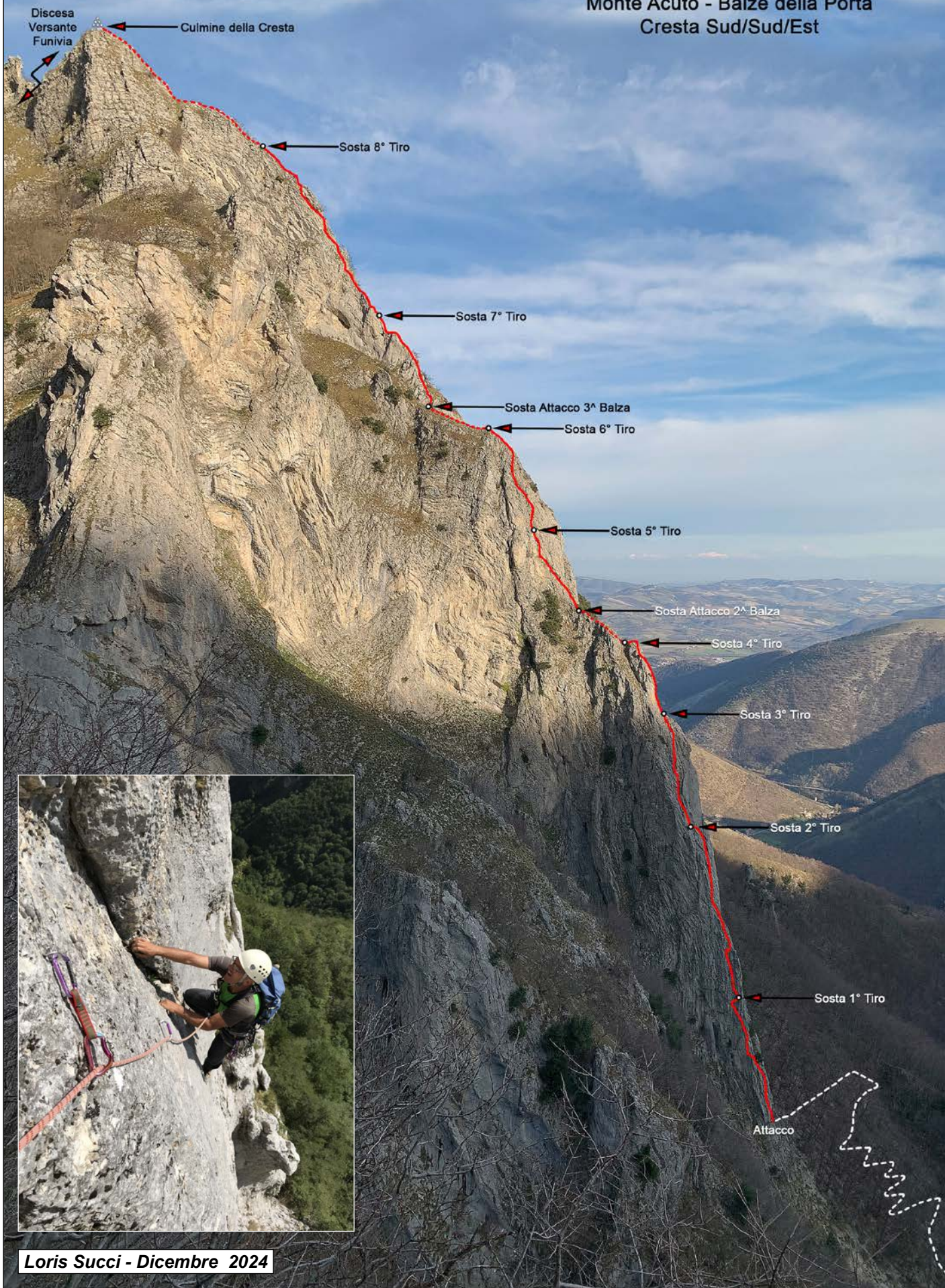
Loris Succi - Dicembre 2024