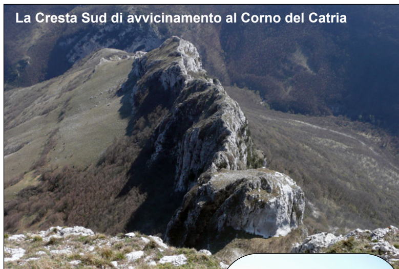
La Cresta Sud di avvicinamento al Corno del Catria

della strada il Sentiero CAI 284 che, a monte delle recinzioni paramassi, guadagna dolcemente quota in direzione di Isola Fossara. Dopo circa trenta minuti, a 660 metri di quota, si raggiunge la base della Cresta Sud che scende dal Corno del Catria. Si sale all'inizio per un largo pendio erboso poi la cresta si fa sempre più affilata e rocciosa obbligando in diversi punti all'uso delle mani. La roccia è sempre molto buona e offre una salita bella e di soddisfazione. In un breve tratto molto affilato ed esposto, alcuni Spit collegati con un cavo di acciaio offrono la possibilità di assicurarsi. Superate queste ultime difficoltà si raggiunge "l'anticima" del Corno del Catria. A questo punto per raggiungere la sella che separa l'anticima dal Corno del Catria occorre deviare a destra e scendere, aiutati anche da alcuni alberi, un ripido canale. Prima del suo termine si esce verso sinistra e si raggiunge per pendio erboso una selletta