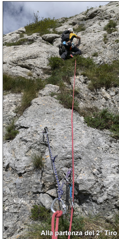
Alla partenza del 2° Tiro

2° Tiro. Dalla sosta si scala in verticale la parete sovrastante evitando di salire le placche alla nostra sinistra chiodate con tre Fix, (linea di salita comunemente relazionata e seguita) ma che risulta illogico andare a prendere dal punto in cui si è sostato. Si prosegue stando sempre a destra delle placche su rocce più articolate fino a un vecchio Spit, ancora dritti fino ad un chiodo e ancora più sopra ad un altro vecchio Spit. Ancora qualche metro verso sinistra per raggiungere una placca appoggiata dove si trova la sosta, a monte delle placche evitate alla nostra sinistra. 20 metri. V-. Sosta su 2 Spit.