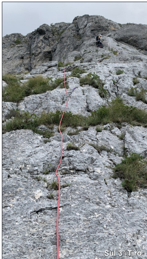
Sul 3° Tiro

3° Tiro. Si riparte in verticale fino a un chiodo, poi dopo aver superato una facile placca appoggiata, si prosegue verso destra per facili roccette, fino a raggiungere una sorta di cengia. Si continua verso la base del pilastro, logica prosecuzione della via, a sinistra di un evidente diedro. Una breve fessura/diedro permette di guadagnare qualche metro per continuare, sul pilastro di roccia compatta, su difficoltà continue, seguendo la fila degli Spit, fino ad uscire sul culmine di una rampa di rocce erbose proveniente da sinistra dove si trova un comodo punto di sosta.