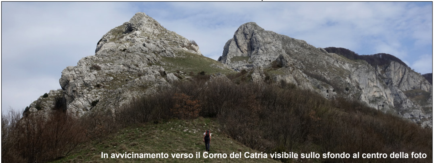
In avvicinamento verso il Corno del Catria visibile sullo sfondo al centro della foto

NOTIZIE. Per raggiungere in automobile il Corno del Catria, dalla A14 si esce al casello autostradale di Fano e si prosegue per la S.S. 3 in direzione Roma. Dopo 70 km circa, superata la galleria nei pressi del paese di Cagli si continua per altri 5 km circa e si esce dalla Statale allo svincolo con indicazione Cantiano. Superato il paese di Cantiano poco dopo si attraversa Chiaserna. Una decina di chilometri dopo, la strada in località Valdorbica, si immette sulla S.S. 326 che da Scheggia conduce a Sassoferrato. Si gira a sinistra per Isola Fossara, per parcheggiare, subito dopo, sulla destra in una piazzola erbosa ai bordi della strada. Il Sentiero CAI 284 utilizzato per l'avvicinamento alla via si imbecca al di là della strada all'inizio delle reti di protezione caduta sassi.